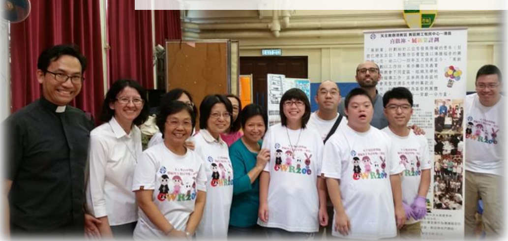
中九龍總鐸區「飛一般環遊」傳教節